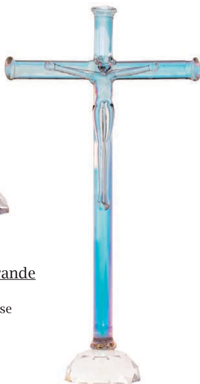
Croce con base Swarovski piccola Swarovski small cross with base Croix petite de Swarovski avec base