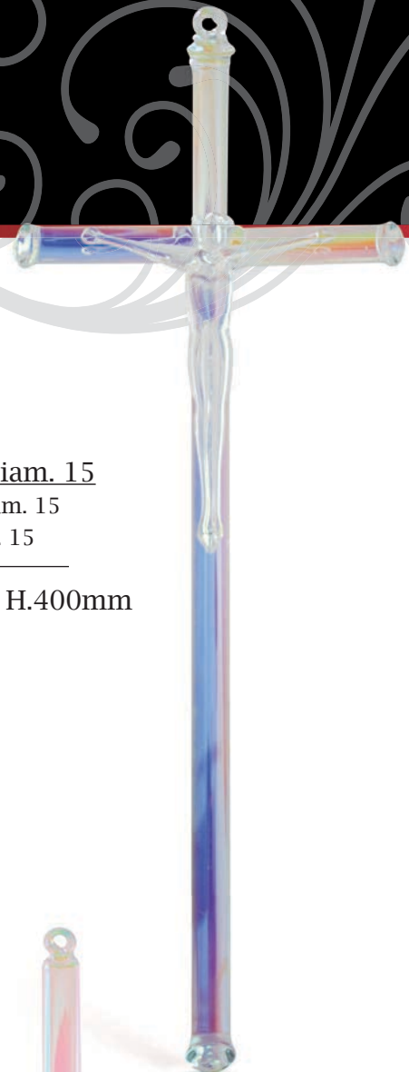
Croce Tonda diam. 15 Circular Cross diam. 15 Croix ronde diam. 15 Art: AS/0001 - H.400mm