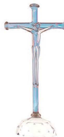
Croce con base Swarovski mini Swarovski mini cross with base Croix mini de Swarovski avec base