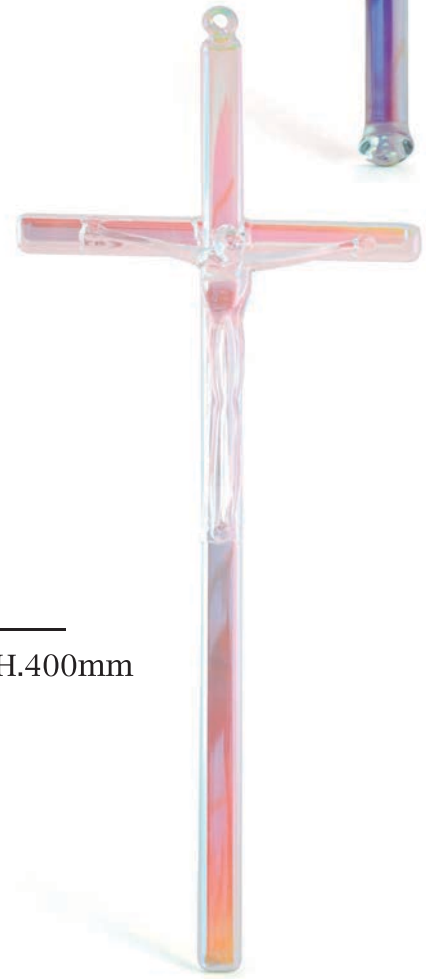
Croce Piatta Flat cross Croix plate Art: AS/0004 - H.400mm