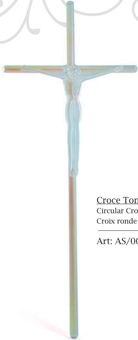
Croce Tonda diam. 9 Circular Cross diam. 9 Croix ronde diam. 9 Art: AS/0003 - H. 400mm