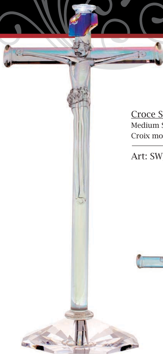
Croce Swarovski media con base Medium Swarovski cross with base Croix moyenne de Swarovski avec base